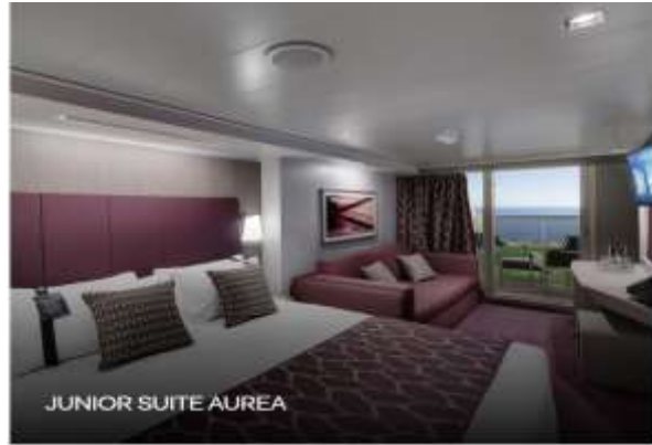
JUNIOR SUITE AUREA

Surface 17 sqm, balcony 5 sqm, deck 9-10 Sitting area with sofa Bathroom with shower or bathtub, vanity area with hairdryer Comfortable double or single beds (on request) Interactive TV, telephone, Wifi connection available (for a fee), safe and minibar