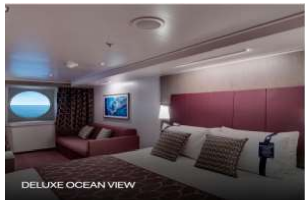
DELUXE OCEAN VIEW

Surface 14 sqm, deck 5-10 Bathroom with shower, vanity area with hairdryer Comfortable double or single beds (on request*) Interactive TV, telephone, wifi connection available (for a fee), safe and minibar Can accommodate up to 5 people