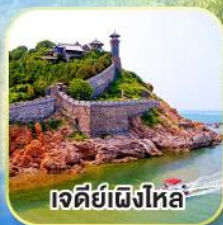
เจดีย์เฟิงไหล