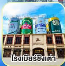
โรงเบียร์ซิงเต่า