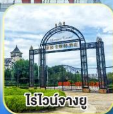
ไร่วังจางยู