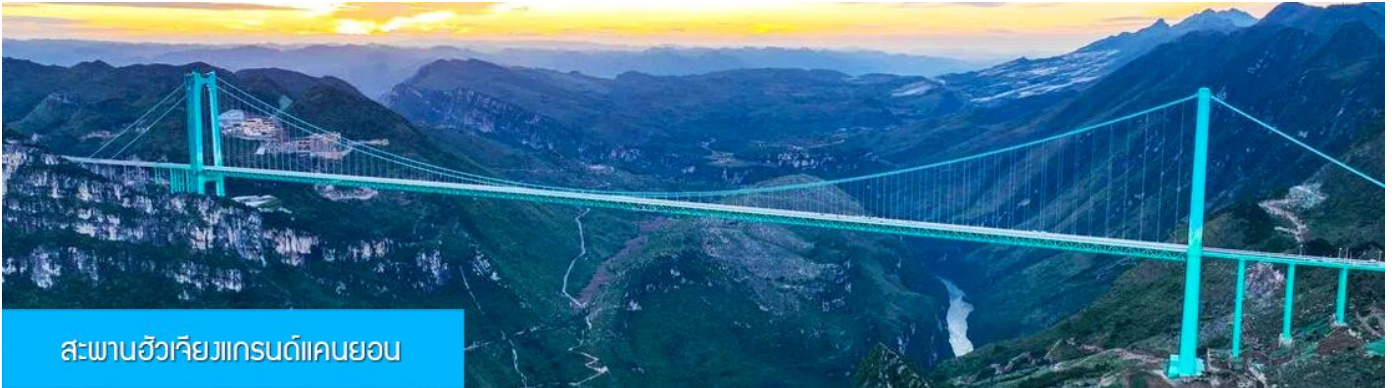
สะพานฮัวเจียงแกรนด์แคนยอน

รับประทานอาหารเช้า ณ ภัตตาคาร (มื้อที่ 7)