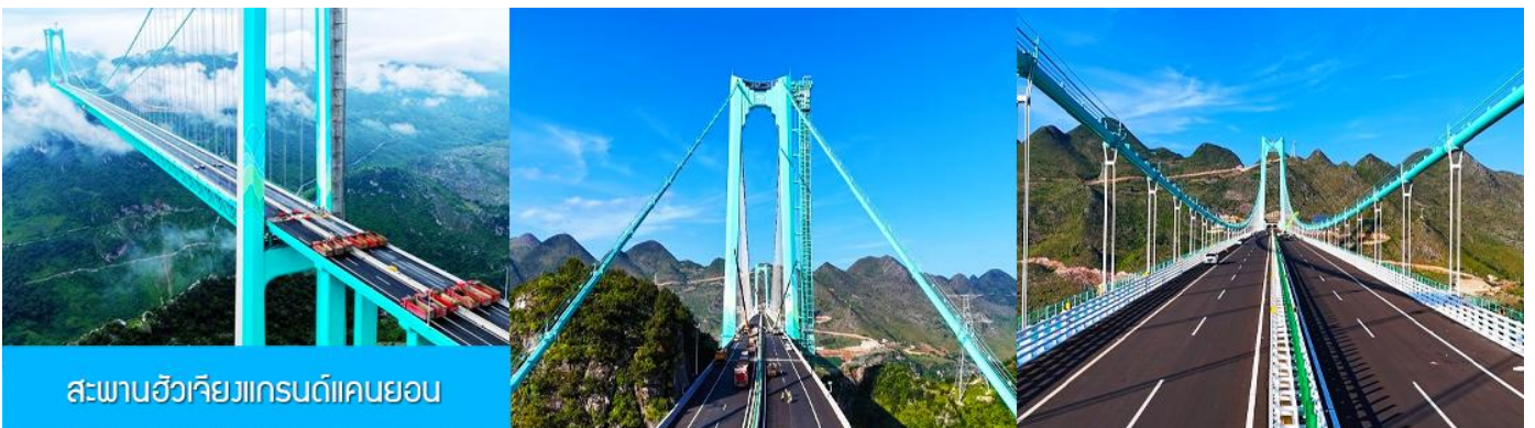
สะพานฮัวเจียงแกรนด์แคนยอน