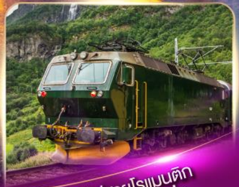
รถไฟสายโรแมนติก ฟลิมส์บาน่า