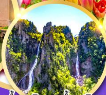
น้ำตกทิงกะ-น้ำตกริวเซ