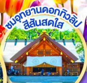
ชมอุทยานดอกทิวลิป สีแสนสดใส