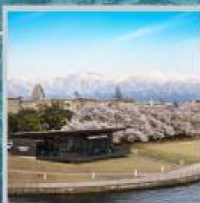
"TOYAMA KANSUI PARK"