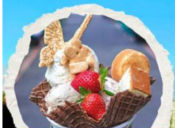
ร้านไอศกรีมมิยาฮาระ