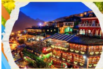
หมู่บ้านโบราณฉิวเฟิ่ง