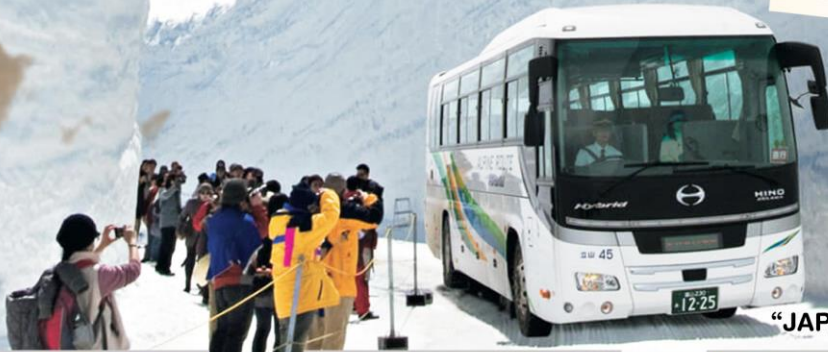
“JAPAN ALPINE ROUTE”