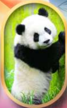
ศูนย์อนุรักษ์หนีแพนด้า