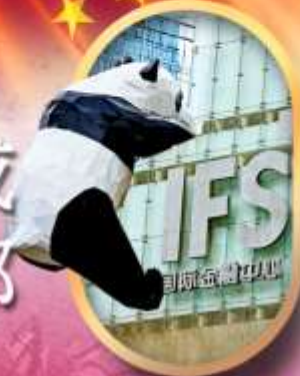
IFS หนีแพนด้าป็นตึก