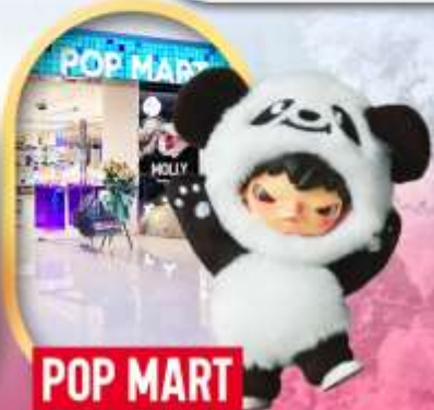
ช้อปปิ้งร้าน Pop Mart