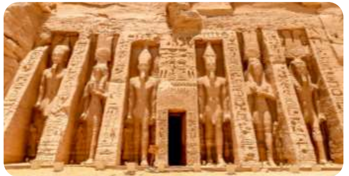
สมควรแก่เวลานำท่านเดินทางกลับเมืองอัสวาน