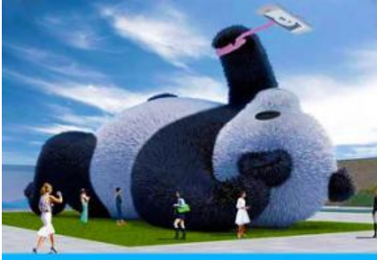
ตุ๊กตาแพนด้าออนไลน์