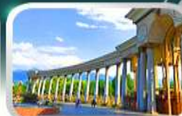
1st President Park