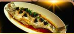
ปลาประรานาบดี