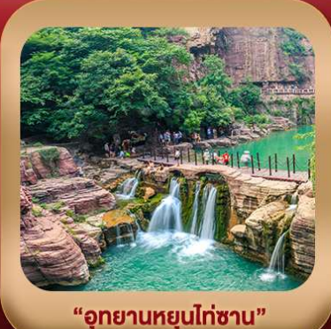
“อุทยานหยุนไท่ซาน”