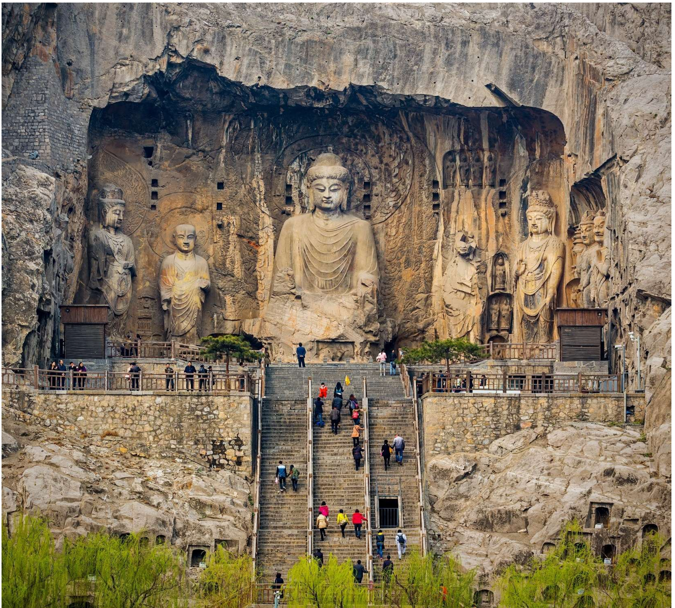
T2G-XIY02(9C) ซีอาน ลั่วหยาง ถ้ำหลงเหมิน หยุนไท่ซาน วัดเส้าหลิน สุสานจีนซี 6D 5N (FD)

ถ้ามีความยาวจากทิศเหนือจรดทิศใต้ประมาณ 1 กม. จัดเป็น 1 ใน 3 แหล่งปฏิมากรรมโบราณที่ประกอบด้วย ถ้ำผาม่อเกาคู ถ้ำผาลงเหมิน และถ้ำผาหยุนกั๋ง ที่มีชื่อเสียงที่สุดในจีน ถ้ำผาลงเหมินแห่งนี้ มีอายุราว 1500 ปี เริ่มก่อสร้างในสมัยราชวงศ์เว่ยเหนือ ค.ศ.494 ใช้ระยะเวลาในการก่อสร้างบูรณะและต่อเติมยาวนานถึง 400 กว่าปี จนถึงยุคราชวงศ์ถังและซ่ง ( ราคาทัวร์รวมรถแบตเตอร์แล้ว )