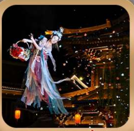
“เมืองโบราณลั่วหยาง”

ชมถ้ำหลงเหมิน มรดกโลกที่เมืองลั่วหยาง • สู่สานจีนซีฮ่องเต้ • ศาลเจ้ากวนอู วัดเส้าหลิน + ป่าเจดีย์ + ชมโชว์กังฟู • เมืองโบราณลั่วหยาง • อุทยานหยุนไท่ซาน เจดีย์ห่านป่าใหญ่ • ถนนวัฒนธรรมต้าถัง • ถนนคนเดินอิสลาม • จัตุรัสหออระขิง