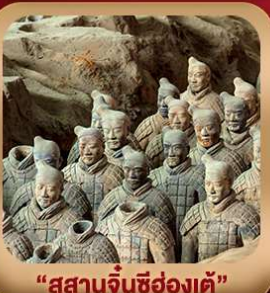
“สู่สานจีนซีฮ่องเต้”

ชมถ้ำหลงเหมิน มรดกโลกที่เมืองลั่วหยาง • สู่สานจีนซีฮ่องเต้ • ศาลเจ้ากวนอู วัดเส้าหลิน + ป่าเจดีย์ + ชมโชว์กังฟู • เมืองโบราณลั่วหยาง • อุทยานหยุนไท่ซาน เจดีย์ห่านป่าใหญ่ • ถนนวัฒนธรรมต้าถัง • ถนนคนเดินอิสลาม • จัตุรัสหออระขิง