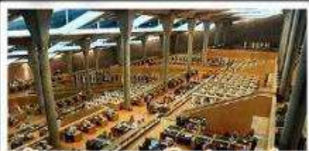
ห้องสมุดอเล็กซานเดรีย