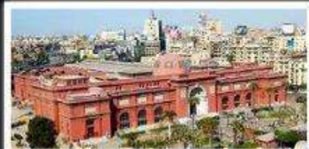
พิพิธภัณฑ์สถานแห่งชาติอียิปต์