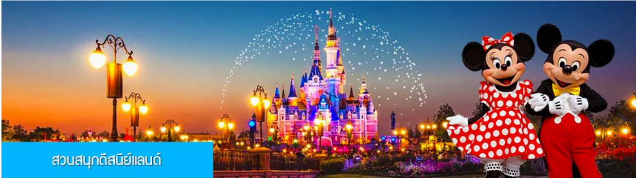
สวนสนุกดิสนีย์แลนด์

พักที่ โรงแรม Tongpai Hotel or Fangyi Hotel 4* หรือเทียบเท่าในเมืองเชียงใหม่