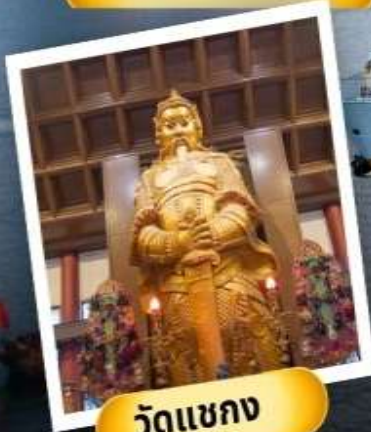
วัดเขากง