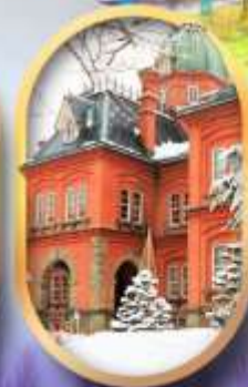
ศาลาว่าการฮอกไกโด