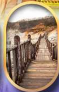
หุบเขาจิกุกดาบิ