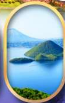
จังหวัดเล سابโตะ