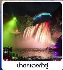
น้ำตกหวงกั๋วซู่