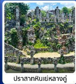
ปราสาทหินเย่หลางกู่

● โฮลท์ น้ำตกหวงกั๋วซู่ น้ำตกที่ใหญ่ที่สุดของจีน แหล่งท่องเที่ยวระดับ 5A ชมความสวยงาม หมู่บ้านวูเจียงจ้าย หมู่บ้านจินโบราณ