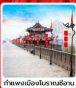
กำแพงเมืองโบราณซีอาน