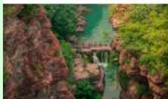
อุทยานสวรรค์หยุนโตซาน