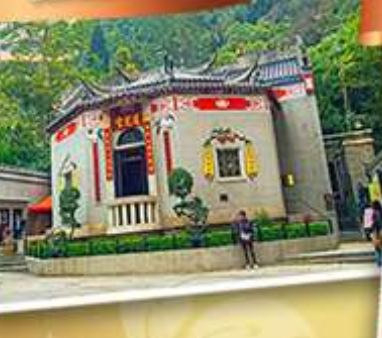
องค์อ้อยส้ม