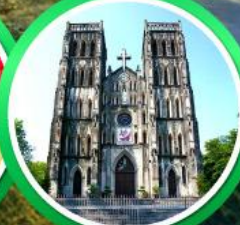
โบสถ์เซนต์โจเซฟ