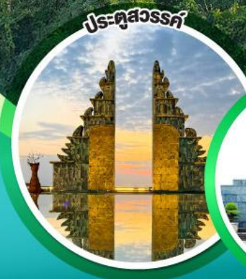
ประตูลสวรรค์