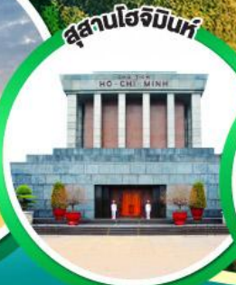
สุสานโฮจิมินห์