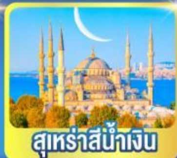
สุหรัสน้ำเงิน