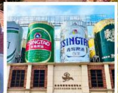
พิพิธภัณฑ์เบียร์ชิงเต่า