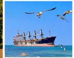
เรือสินค้าเกย์ตันบลูอิส