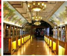
พิพิธภัณฑ์ไวน์ชิงเต่า