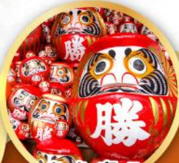
วัดคัตสึโฮจิ (วัดदारุมะ)

ชมความงามของกำแพงหิมะ เส้นทางสายอัลไพน์ทาเคยาม่า (JAPAN ALPS SNOW WALL)