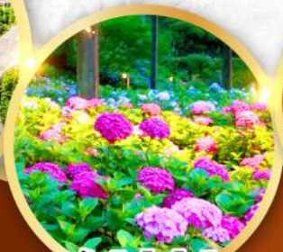
วัดมิมุโระโทจิ