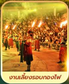
งานเลี้ยงรอบกองไฟ