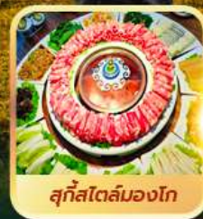
สุกีสโตล์มองโก