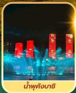
น้ำพุคังบาซี