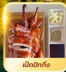
เบ็ดปักกิ้ง