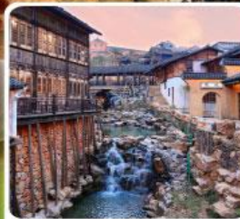
เมืองโบราณเหยahu