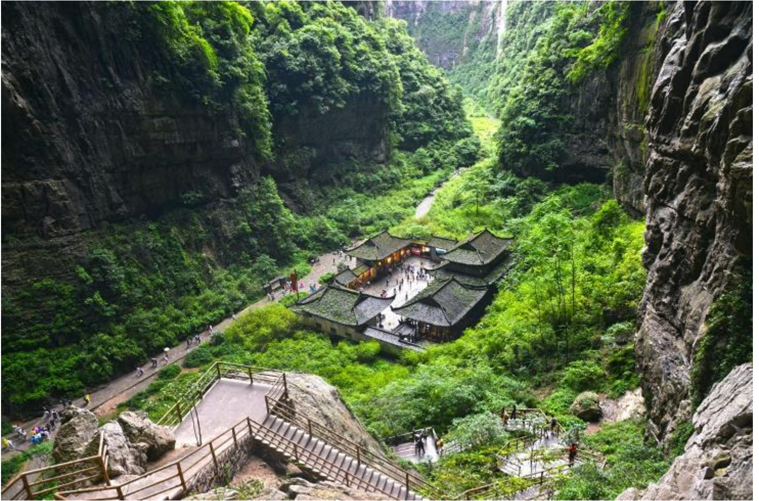
กลางวัน รับประทานอาหารกลางวัน ณ ภัตตาคาร (มื้อที่ 5)