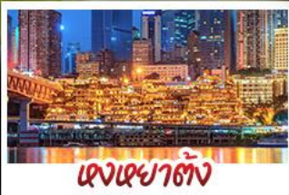
ฉางเฉาตั้ง