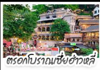
ตรอกโบราณเขี่ยฮ่าวหลี่