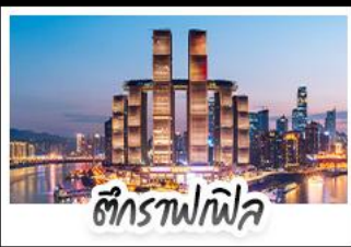
ตึกรางฟฟ้า