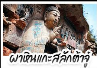
พ่าหิ้นแกะสลักคำจู๋