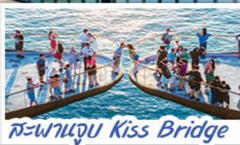
สะพานจูบ Kiss Bridge