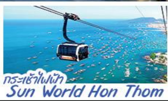
กระเช้าไฟฟ้า Sun World Hon Thom