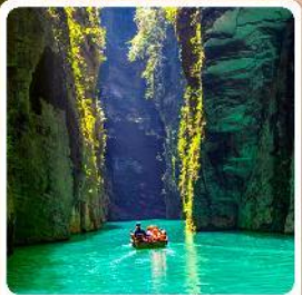
ผิงซานแกรนด์แคนยอน