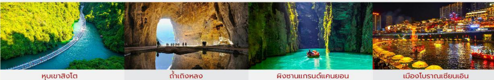
หุบเขาสิงโต