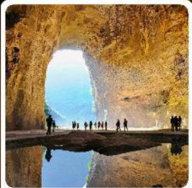
ถ้ำถึงหลง