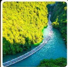
คุบเขาสิงโต

ไฮไลท์! ปืนตรงลงเอนชอ ที่ยาวเอนชอนั้นๆจัดเต็มทั่วเมือง คุบเขาสิงโต ผิงซานแกรนด์แคนยอน อุทยานจิ้นลี่ซาน