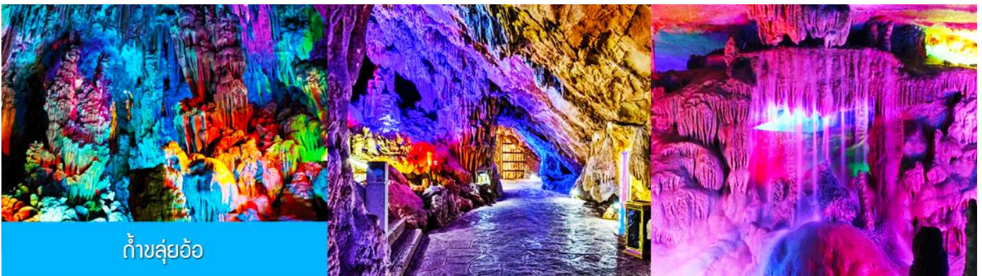
ถ้ำขลุ่ยอ้อ

พักที่ VIENNA INTER HOTEL ระดับ 4 ดาวท้องถิ่นหรือเทียบเท่าในเมืองก๊วยหลิน