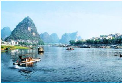
ล่องเรือแพ ณ ท่าเรือริมแม่น้ำหลีเจียง