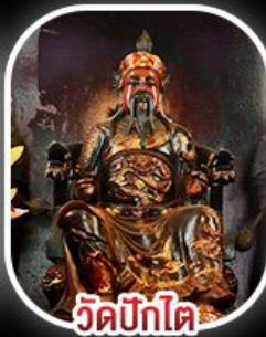
วัดบิกิต