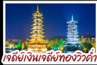
เจดีย์เงินเจดีย์ทองวิวคำ

เมนูพิเศษ บุฟเฟ่ต์ชาบูซีฟู้ด ปลาอบเบียร์ ฝัอกคริสตล สุกี้เห็ด