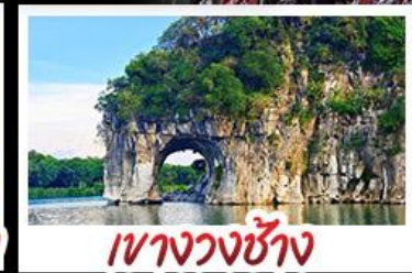
เขาวงซ้าง