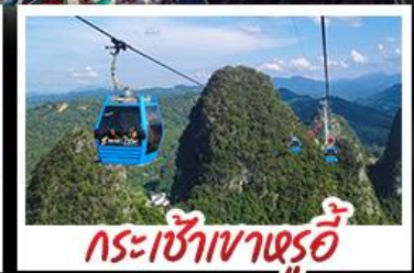
กระเช้าเขาหุ่ย