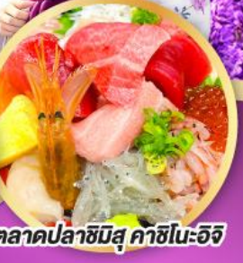
ตลาดปลาฮิมิสึ คาชิโนะอิชิ