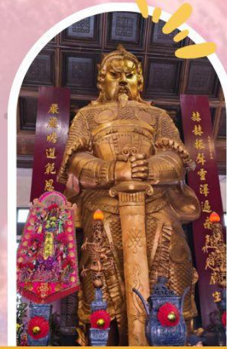
วัดแซกง ขอพรโชคลาก การเงิน และธุรกิจ