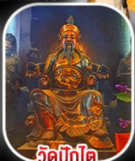
วัดทิ๊กโต