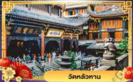
วัดหลัวหนาน