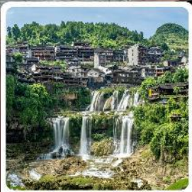
ฝูหลงเจิน