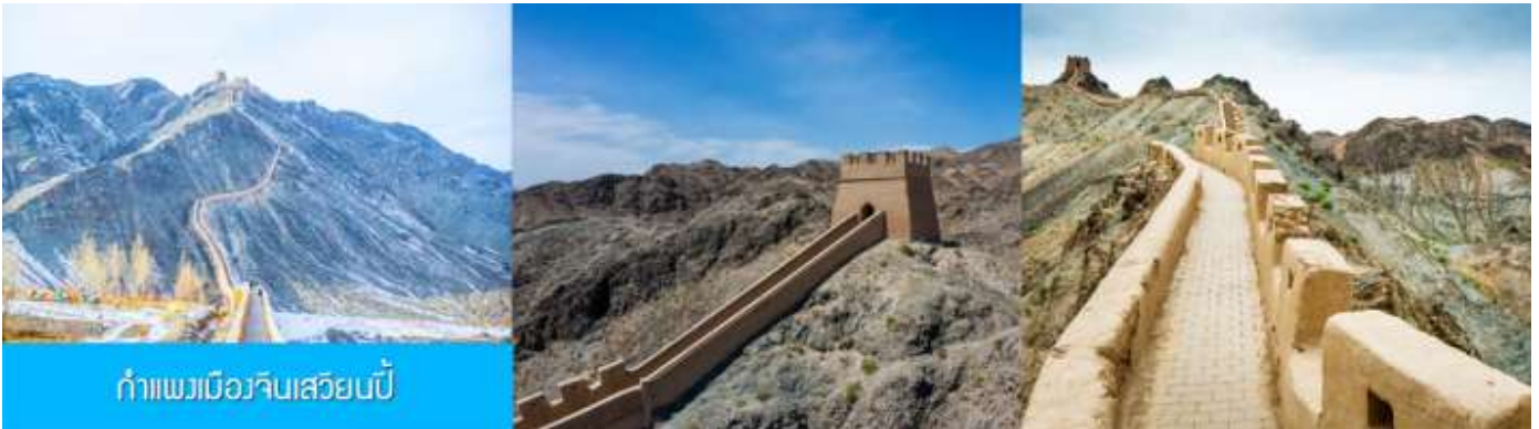
กำแพงเมืองจีนเสียนบี