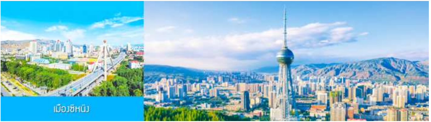
เมืองซีหนิง