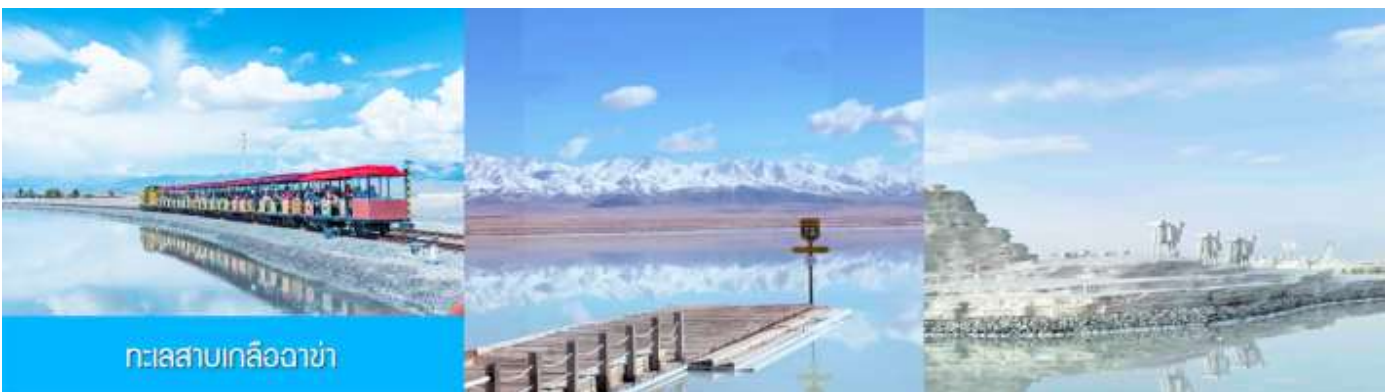
ทะเลสาบเกลือฉาซ่า