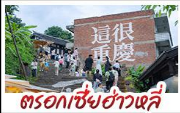
ตรอกเซี่ยงฮ่าวหลี่