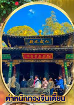
ตำหนักทองเงินเตียน