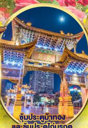
ซุ้มประตูม้าทอง และ ซุ้มประตูโตมรกต