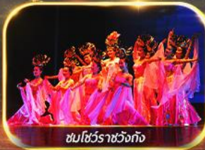
ชมโชว์ราชวงศ์ถัง

นั่งรถไฟความเร็วสูง ย้อนประวัติศาสตร์อันยิ่งใหญ่ "กองทัพทหารจีนซี" สัมผัสความงามอุทยานสวรรค์ พิเศษ!! ชมโชว์ราชวงศ์ถัง เก็บครบทุกไฮไลต์ ซอเป่ิงจู่จาง ห้าง WU YUE