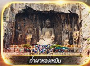
ถ้ำพาลงเหมิน