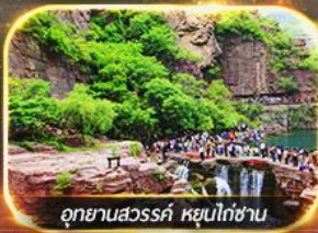
อุทยานสวรรค์ หยุนโก่ซาน