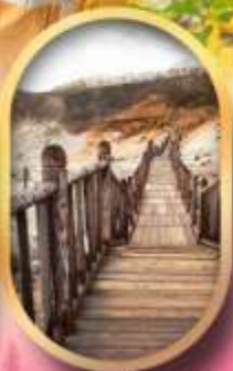
หุบเขาจิทอกุคาบิ