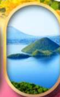
วิวทะเลสาบโทโยะ