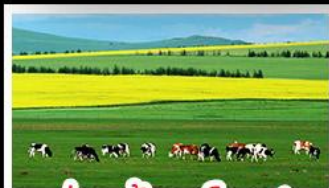
ทุ่งหญ้าเออร์ดอส

ทุ่งหญ้าเออร์ดอส สุสานเจกิสข่าน แกรนด์แคนยอนแม่น้ำเหลือง