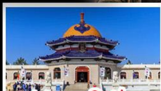
สุสานเจกิสข่าน