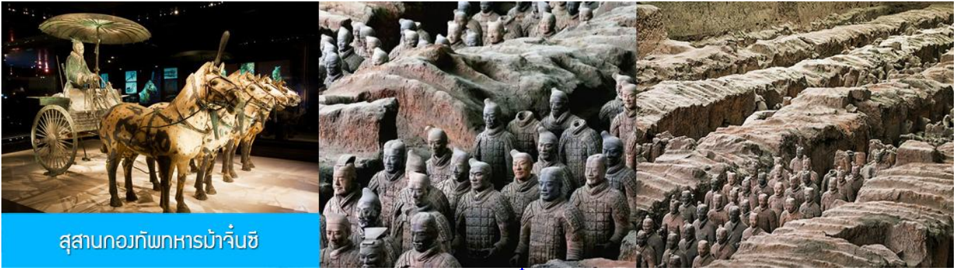
สุสานกองทัพทหารม้าจีน