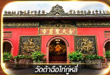
วัดต้าจื่อไท่กุหลี่