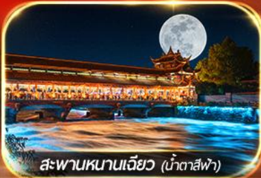
สะพานหนานเจียว (น้ำตาสีฟ้า)