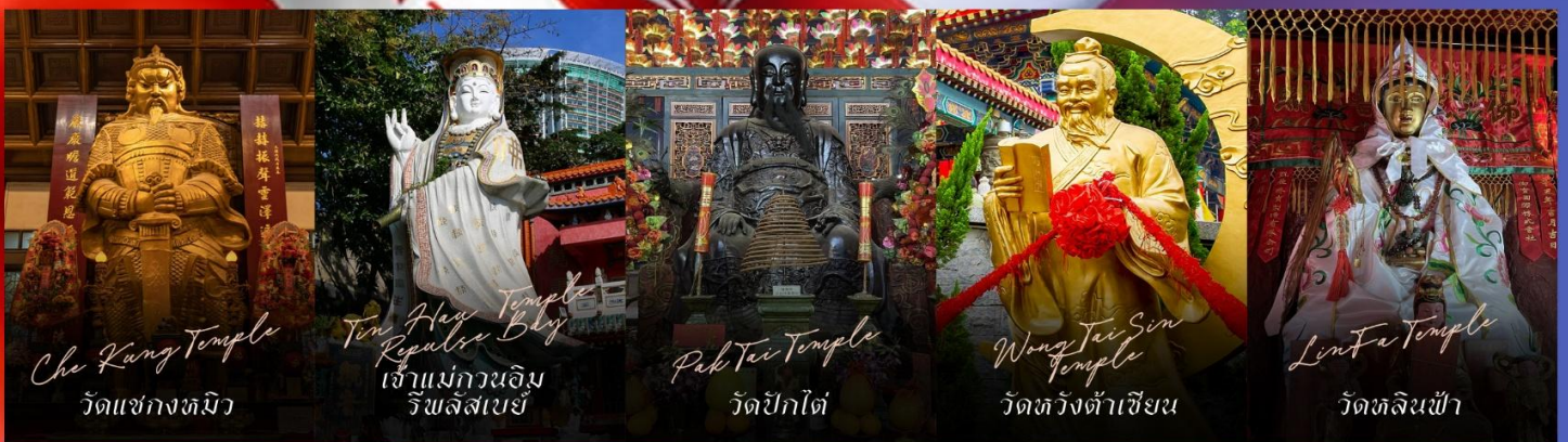
Che Kung Temple วัดแซกงหมิว

รายการทัวร์ข้างต้นอาจมีการปรับเปลี่ยนเพื่อความเหมาะสม