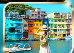
หมู่บ้านประมงเจี๋ยปิ่น