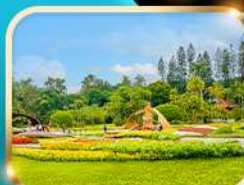
สวนบ้านปรน.เจี๋ยงโคเซ็ก