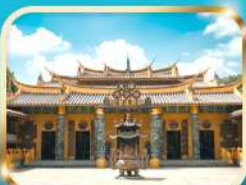
วัดต้าซี ขอความรวย