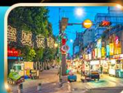
หมิงเซี่ย ไทท์มาร์เก็ต