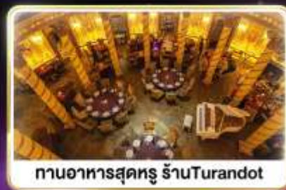
กานอาหารสุดหรู ร้านTurandot