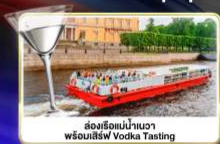
ล่องเรือแม่น้ำแคว พร้อมเสิร์ฟ Vodka Tasting